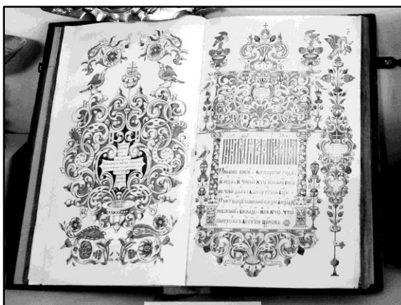
Вкладная книга в экспозиции ВСМЗ

В заглавии книги, следующем за обширным предисловием, указана дата ее составления (1685 г.), имена монастырских властей (при архимандрите Иосифе), название книги «Книга глаголемая вкладная» 2 и её предназначение: «Писано в ней, которого года, и месяца, и числа, кто имянем сколько чево дал в дом пречистыя Богородицы, и чудотворцу великому князю Александру Невскому, вкладом, или кто что построил во святую церковь» 3 .