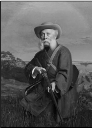
А.М. Колесов. Портрет графа В.П. Орлова- Давыдова. 1860-е гг. ГИМ

С 1879 по 1885 гг. Алексей Михайлович работал заведующим иконописной мастерской в Училище иконописания и ремесел Московского епархиального ведомства, располагавшимся на Большой Ордынке. Игорь Грабарь, известный русский художник и искусствовед, учившийся в те годы в Катковском лицее в Москве, часто заходил в училище иконописания; в его автобиографии есть такие строки: